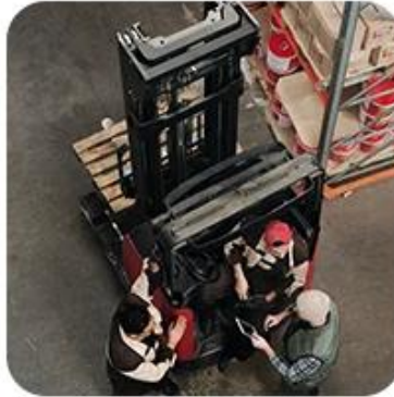
2) Pick-Up Cargo from 1 or Mutli Factory