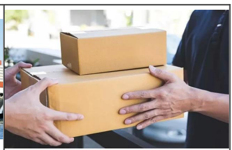
Tür-zu-Tür-Versand von China in die USA Einfacher Versand von China in die USA, von China selbst entwickelter Kanal, zeitsparend und zu wettbewerbsfähigen Preisen, der Service umfasst die Einfuhrzollabfertigung und Zölle. Sie müssen die Waren nur vor Ihrer Haustür erhalten.