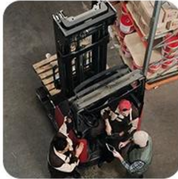
2) Pick-Up Cargo from 1 or Mutli Factory