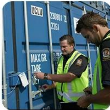
5) Export Customs Clearance