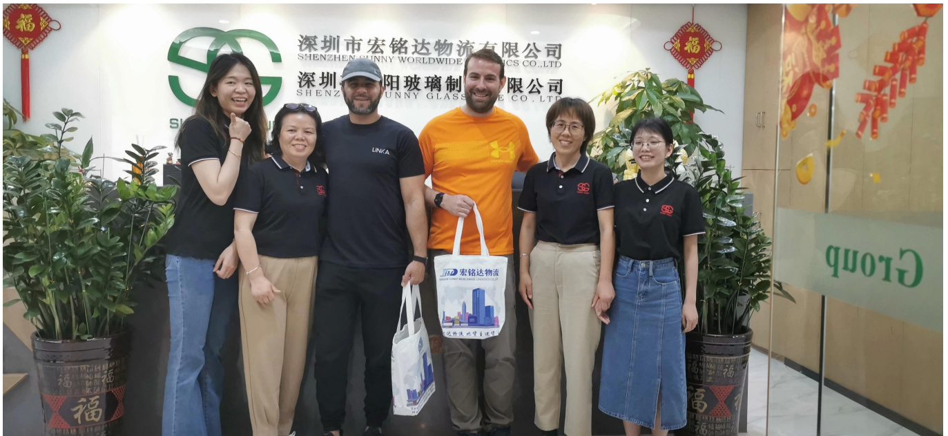
Luftfracht nach Saudi-Arabien