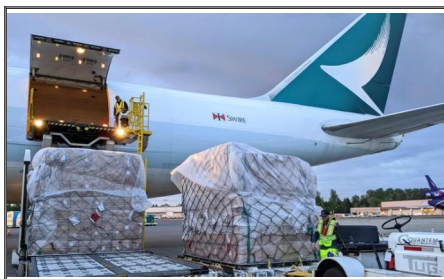
Luftfracht von China nach Kanada SWWLS-Luftfracht bietet zuverlässige und flexible Luftfrachtoptionen, ob Flughafen-zu-Flughafen, Tür-zu-Tür oder eine beliebige Kombination davon. Unsere Spediture werden sorgfältig ausgewählt, um die sichere Lieferung Ihrer Waren von China nach Kanada zu gewährleisten.