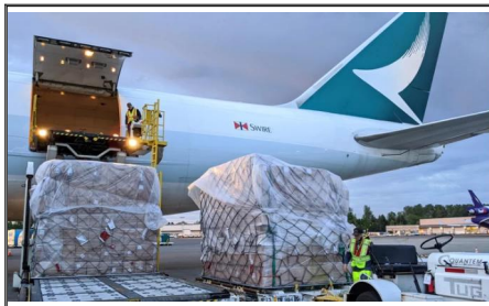
Luftfracht von China nach Kanada SWWLS-Luftfracht bietet zuverlässige und flexible Luftfrachtoptionen, ob Flughafen-zu-Flughafen, Tür-zu-Tür oder eine beliebige Kombination davon. Unsere Spediture werden sorgfältig ausgewählt, um die sichere Lieferung Ihrer Waren von China nach Kanada zu gewährleisten.