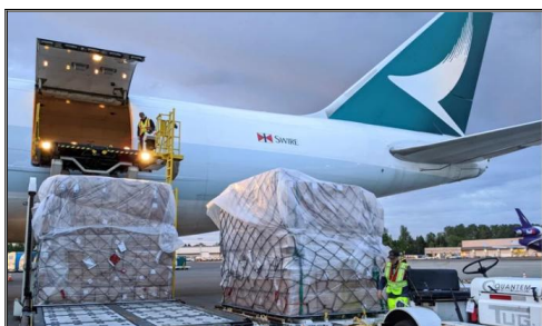
Luftfracht von China in die USA

SWWLS bietet wettbewerbsfähige Luftfracht von FLUGHAFEN zu FLUGHAFEN, Tür-zu-Tür-Versand von China in die USA, Lieferung innerhalb von 2-8 Werktagen mit sorgfältig ausgewählten Spediteuren wie Emirates Airline (EK), Singapore Airlines (SQ), Air China (CA) usw.