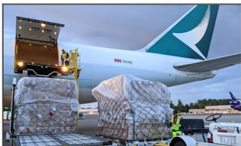
Transporte aéreo de China a EE. UU. SWWLS ofrece transporte aéreo competitivo de AEROPUERTO A AEROPUERTO, envío PUERTA A PUERTA desde China a EE. UU., entrega de 2 a 8 días hábiles con transportistas cuidadosamente seleccionados Emirates Airline (EK), Singapore Airlines (SQ), Air China (CA), etc.