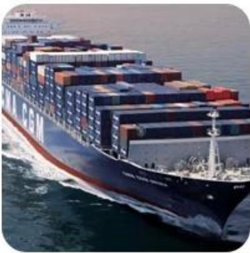
7) Shipping to Destination