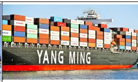
Transporte marítimo de China a Canadá Servicios de transporte marítimo asequibles de puerto a puerto y puerta a puerta desde China a destinos canadienses como Vancouver, Montreal, Toronto y más. Disfrute de una entrega rápida en un plazo de 25 a 35 días y reciba soluciones personalizadas.