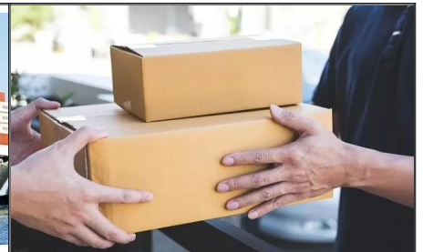
Expédition porte à porte de la Chine vers l'Australie Fret aérien et fret maritime porte à porte vers le Canada, livraisons efficaces et sûres de la Chine au Canada avec service de dédouanement et de droits d'importation à un prix compétitif, ramassage gratuit auprès de vos fabricants chinois.