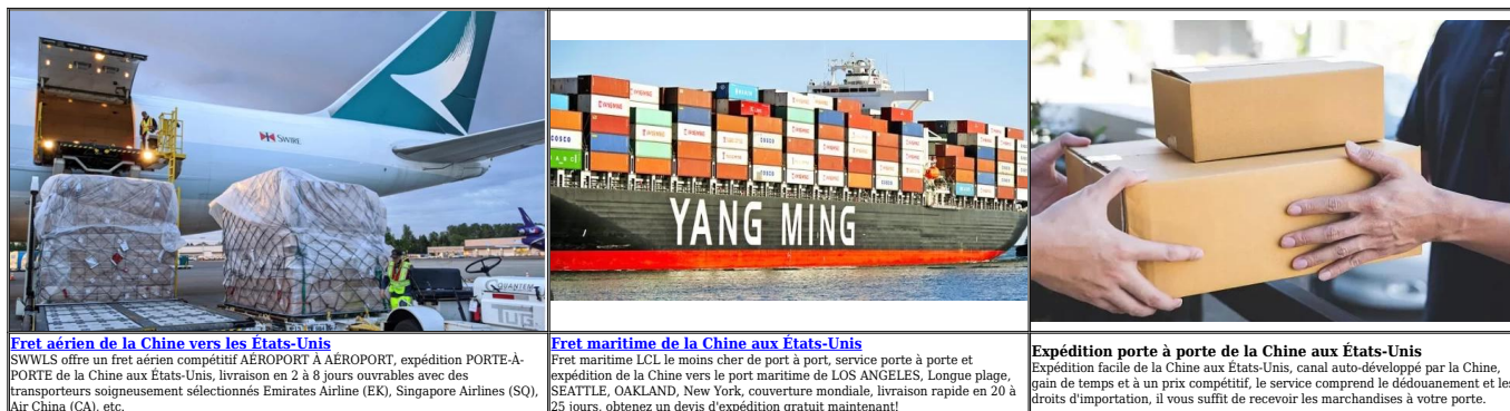
Fret aérien de la Chine vers les États-Unis SWWLS offre un fret aérien compétitif AEROPORT À AEROPORT, expédition PORTE-À-PORTE de la Chine aux États-Unis, livraison en 2 à 8 jours ouvrables avec des transporteurs soigneusement sélectionnés Emirates Airline (EK), Singapore Airlines (SQ), Air China (CA), etc.