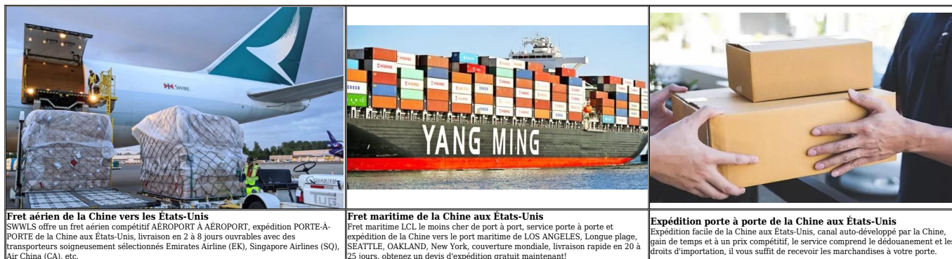
Fret aérien de la Chine vers les États-Unis SWWLS offre un fret aérien compétitif AEROPORT À AEROPORT, expédition PORTE-À-PORTE de la Chine aux États-Unis, livraison en 2 à 8 jours ouvrables avec des transporteurs soigneusement sélectionnés Emirates Airline (EK), Singapore Airlines (SQ), Air China (CA), etc.