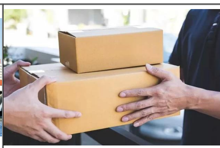
Spedizione porta a porta dalla Cina agli Stati Uniti Spedizione facile dalla Cina agli Stati Uniti, canale sviluppato autonomamente dalla Cina, risparmio di tempo e prezzi competitivi, il servizio include sdoganamento e dazi all'importazione, è sufficiente che tu riceva la merce a casa tua.