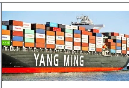
Trasporto marittimo dalla Cina agli Stati Uniti Il trasporto marittimo LCL più economico da porto a porto, servizio porta a porta e spedizione dalla Cina al porto marittimo di LOS ANGELES, Lunga spiaggia, SEATTLE, OAKLAND, New York, copertura globale, consegna rapida in 20-25 giorni, ottieni un preventivo di spedizione gratuito Ora!