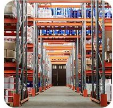
3) Delivery to Warehouse