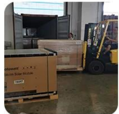
6) Loading to Container