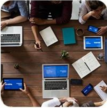
1) Offer Shipping Schedule