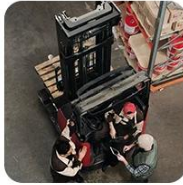
2) Pick-Up Cargo from 1 or Mutli Factory