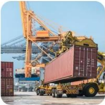
4) Loading on Boat