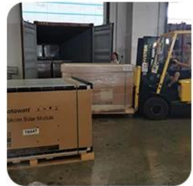
6) Loading to Container