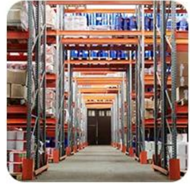
3) Delivery to Warehouse