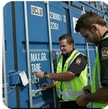
5) Export Customs Clearance