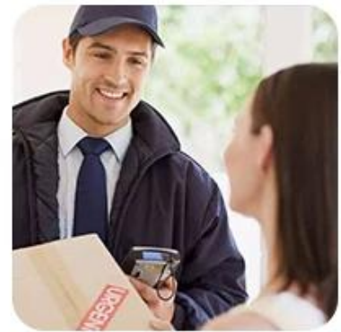
9) Delivery to Door