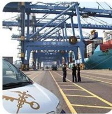
8) Import Customs Clearance