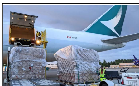
Trasporto aereo dalla Cina all'Australia Le spedizioni aeree SWWLS offrono opzioni di trasporto aereo affidabili e flessibili, sia da aeroporto ad aeroporto, da porta a porta o qualsiasi combinazione. I nostri corrieri sono accuratamente selezionati per garantire la consegna sicura delle vostre merci dalla Cina al Canada.