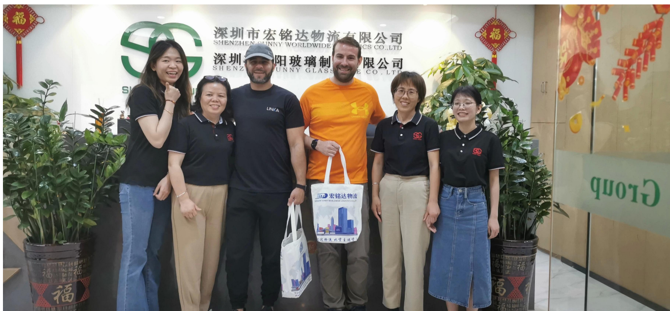
авиаперевозки в Саудовскую Аравию