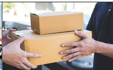
Доставка от двери до двери из Китая в Австралию Авиаперевозки и морские перевозки от двери до двери в Канаду, эффективные и безопасные поставки из Китая в Канаду с таможенным оформлением импорта и пошлинами по конкурентоспособной цене, бесплатный самовывоз от китайских производителей.