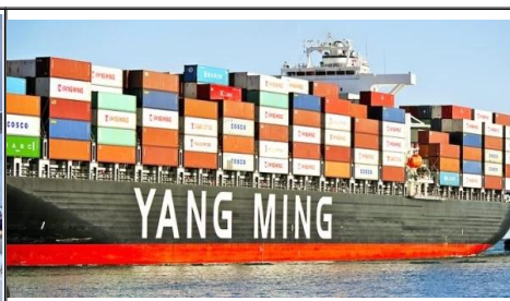
Морские перевозки из Китая в Австралию Доступные морские перевозки «порт-порт» и «от двери до двери» из Китая в такие пункты назначения в Канаде, как Ванкувер, Монреаль, Торонто и другие. Наслаждайтесь быстрой доставкой в течение 25-35 дней и получите индивидуальные решения.